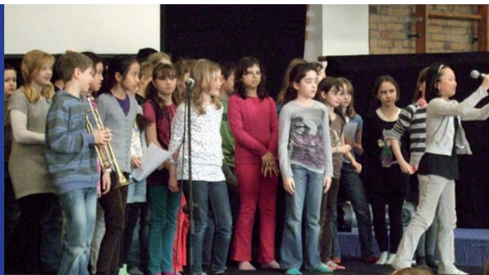
Schüler beim Sprachenfest